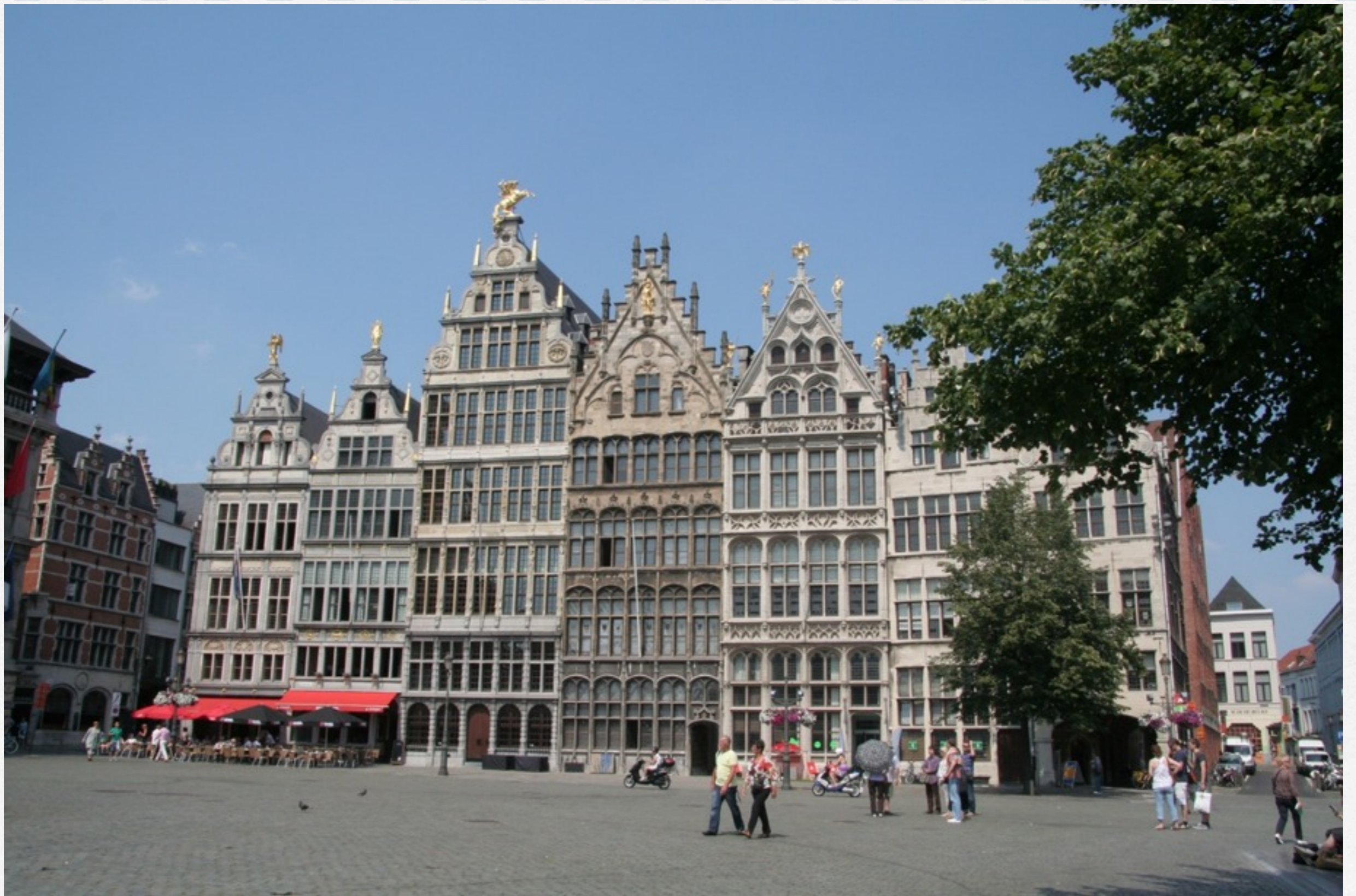
Antvers, la Grand-Place