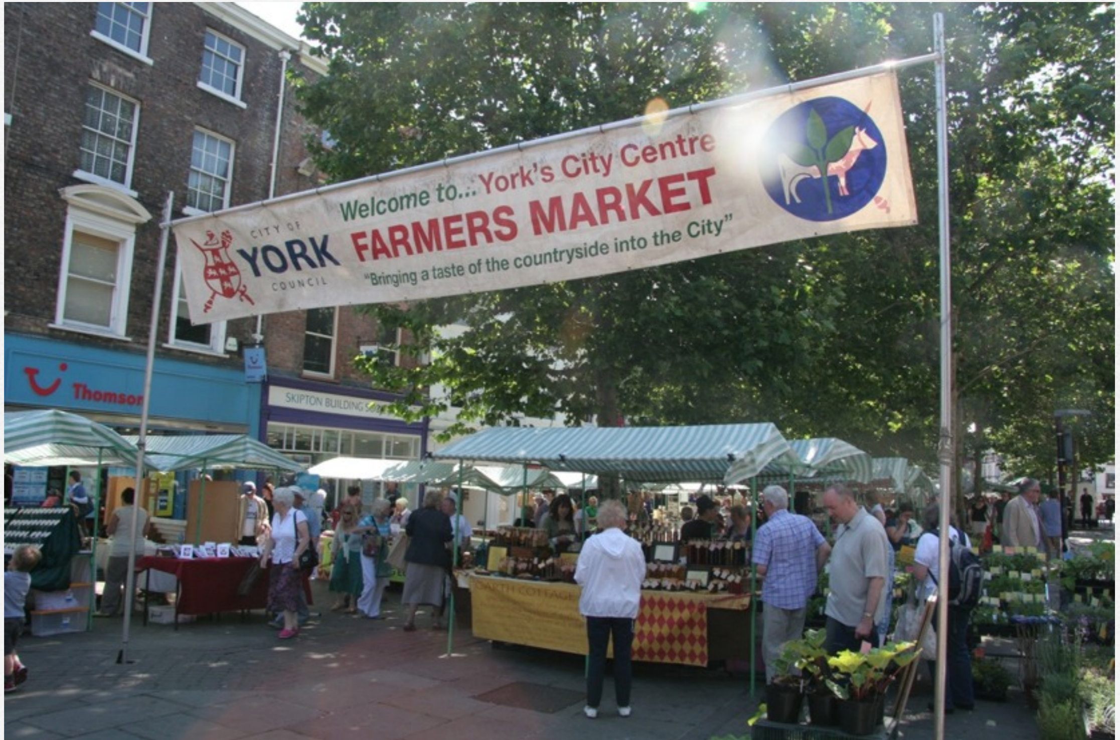
York, petite ville animée et sympa