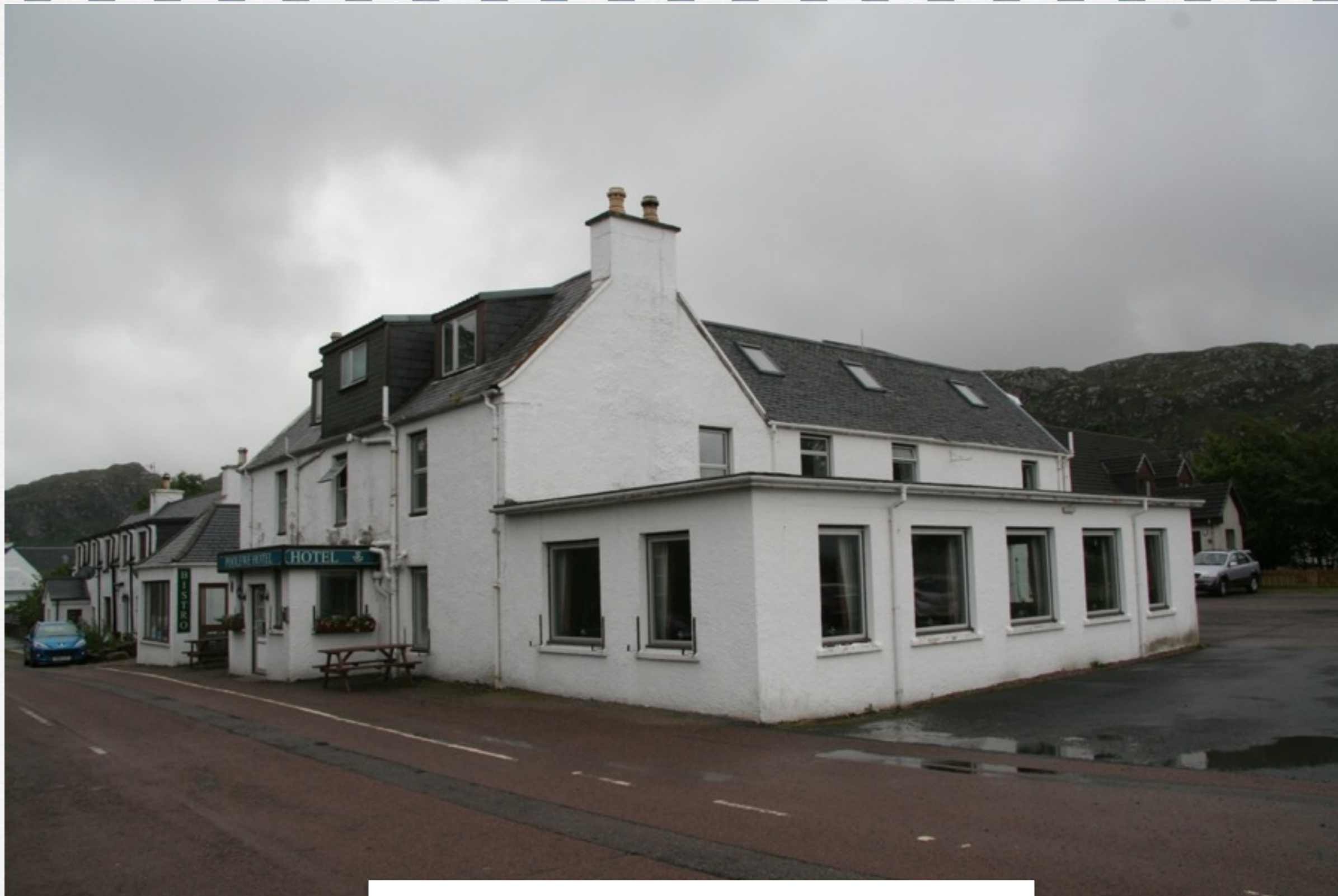
notre hotel à Poolewe, au bout du monde