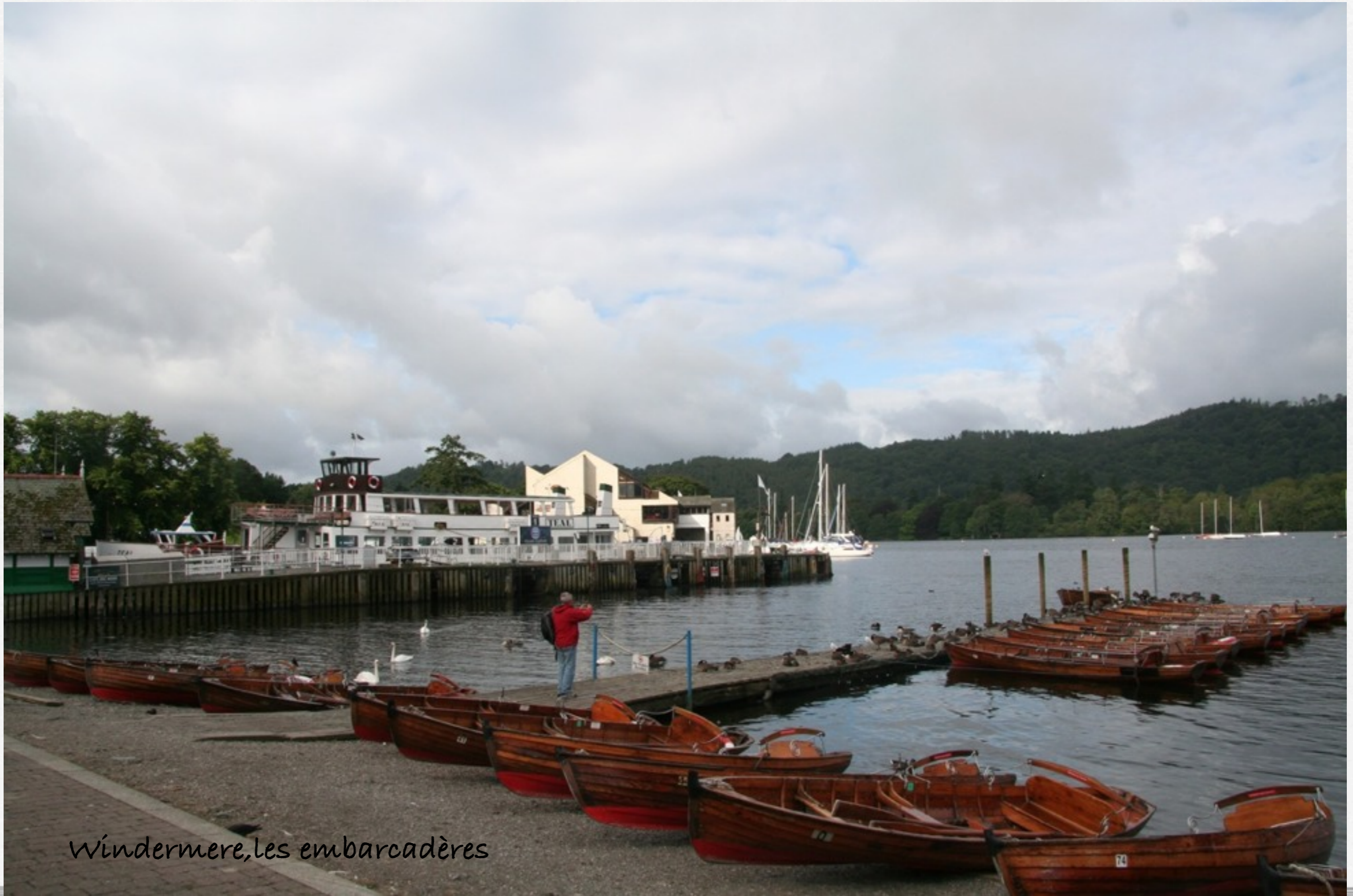
Windermere, les embarcadères