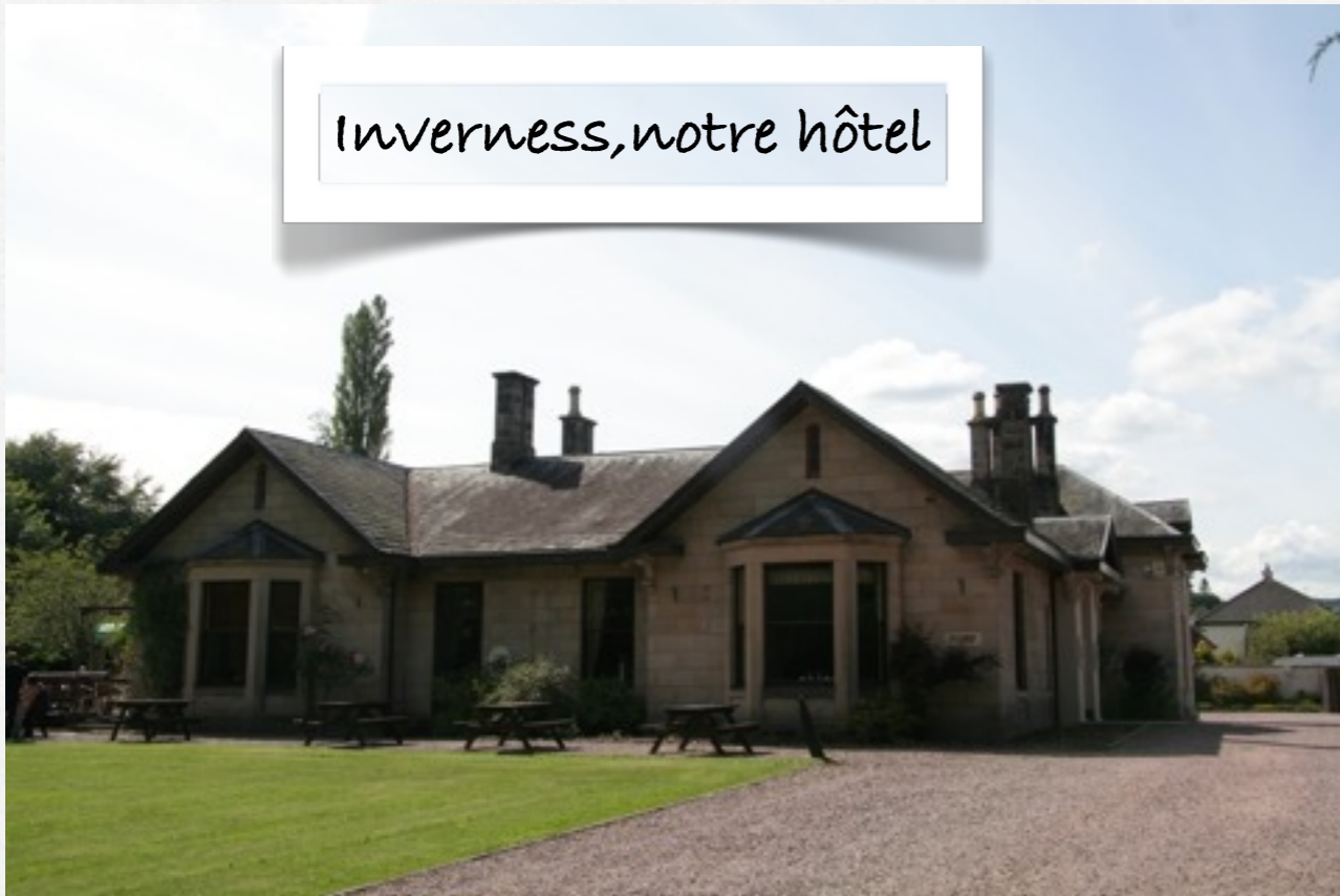
Inverness, notre hôtel