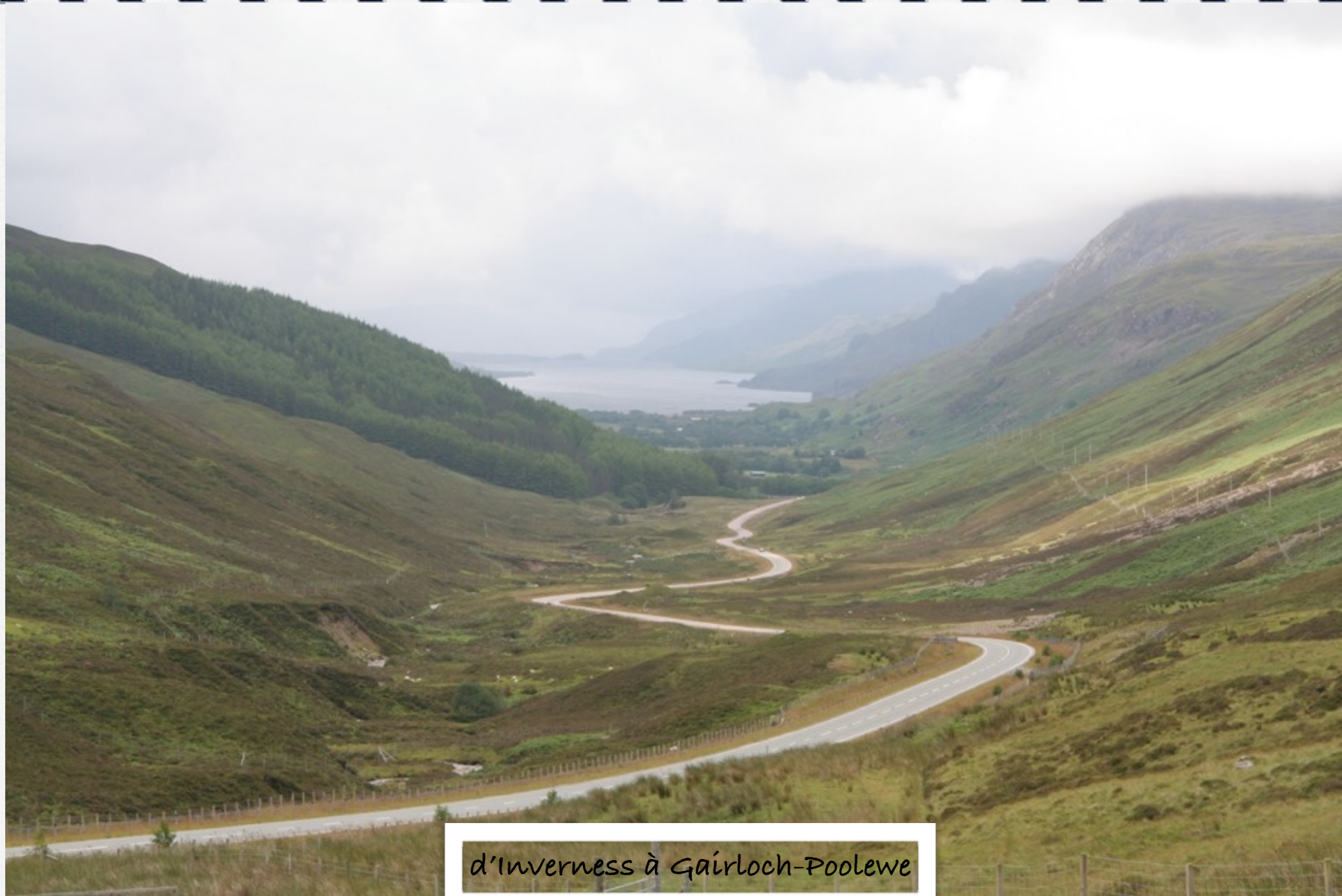
d'Inverness à Gairloch-Poolewe