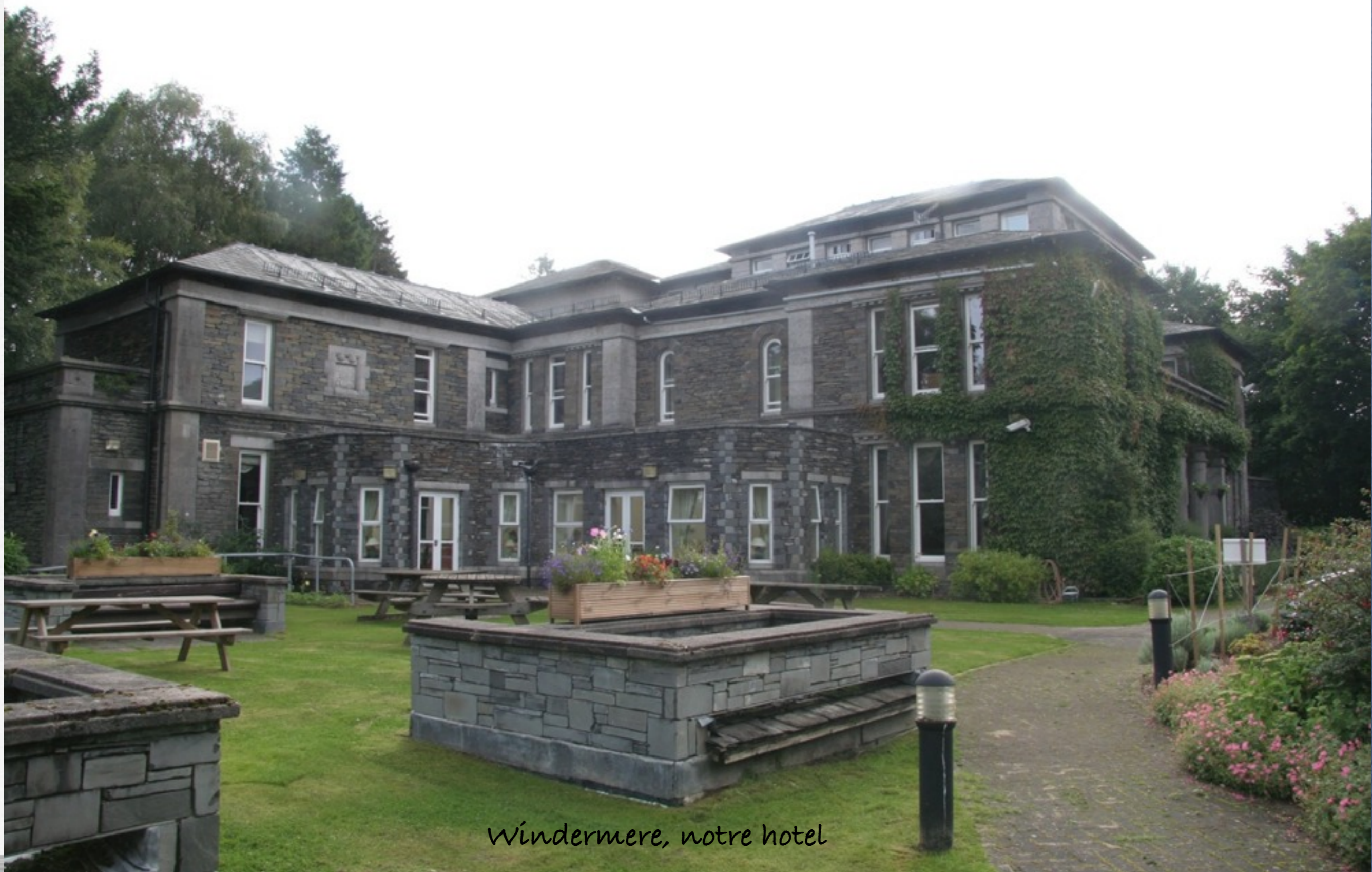
Windermere, notre hotel