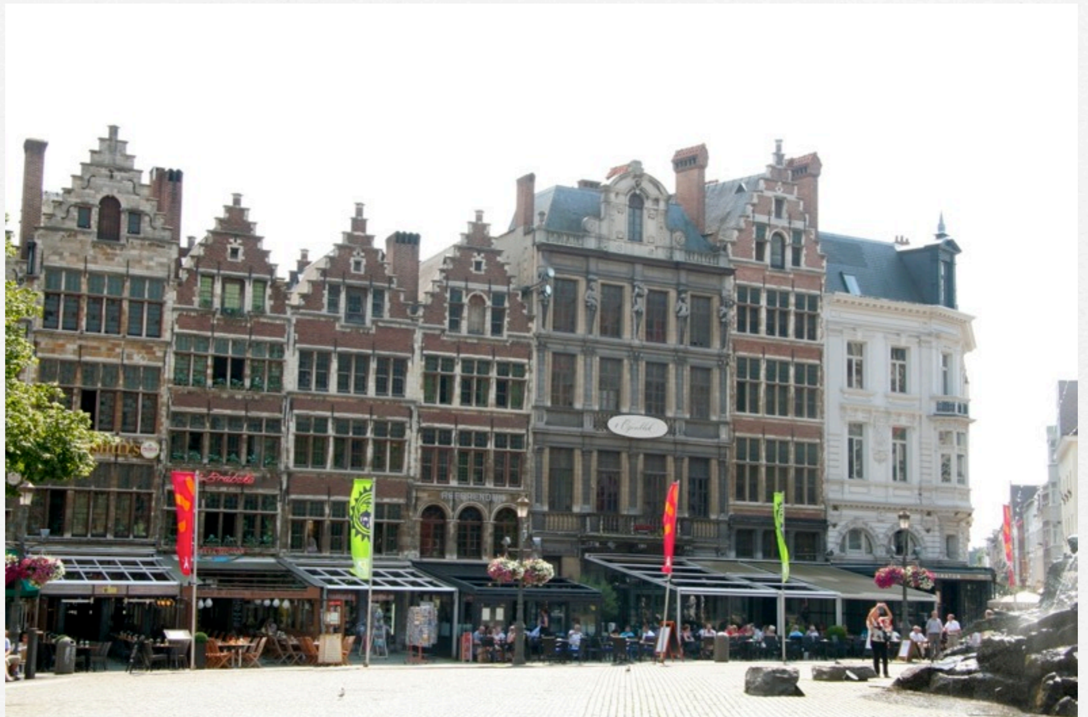
Antvers, des centaines de places en terrasse