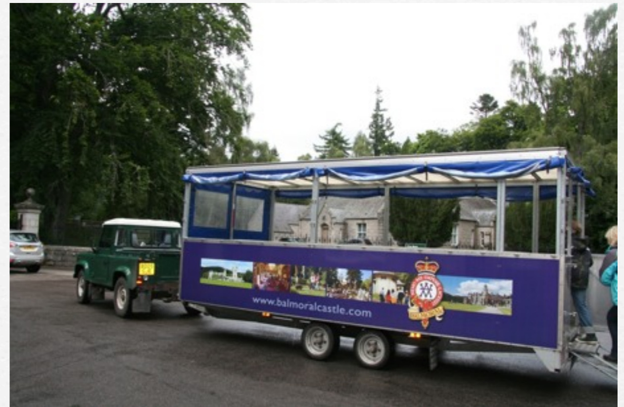
on franchit la Dee pour arriver au château