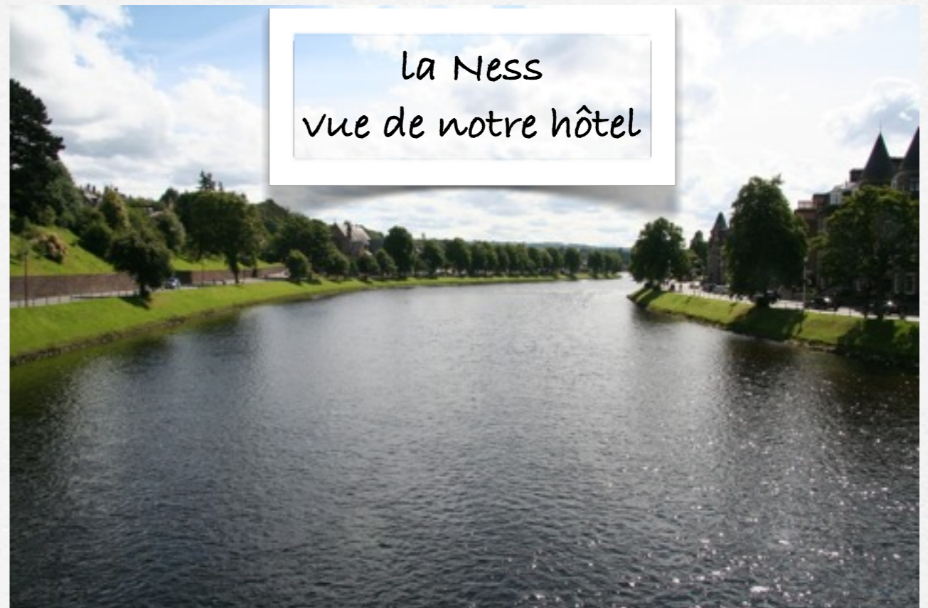
La Ness vue de notre hôtel