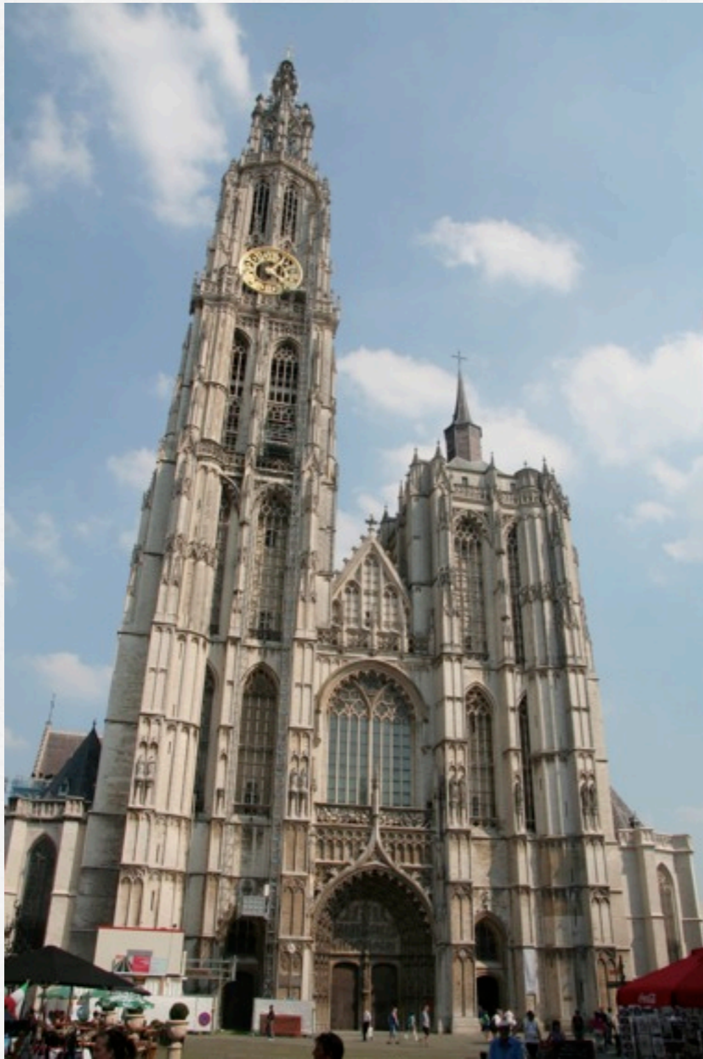
Anvers, la cathédrale