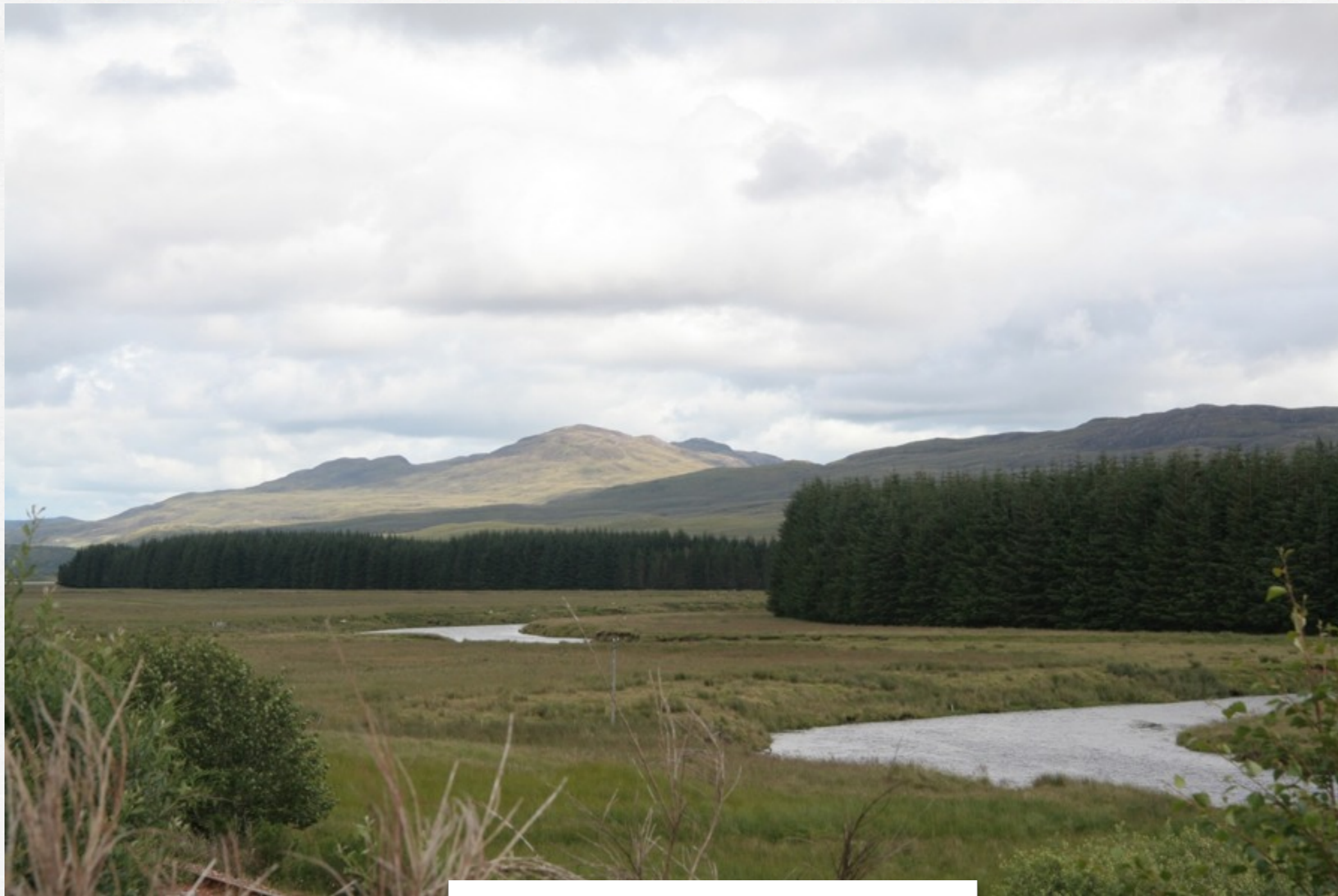
d'Inverness à Gairloch-Poolewe