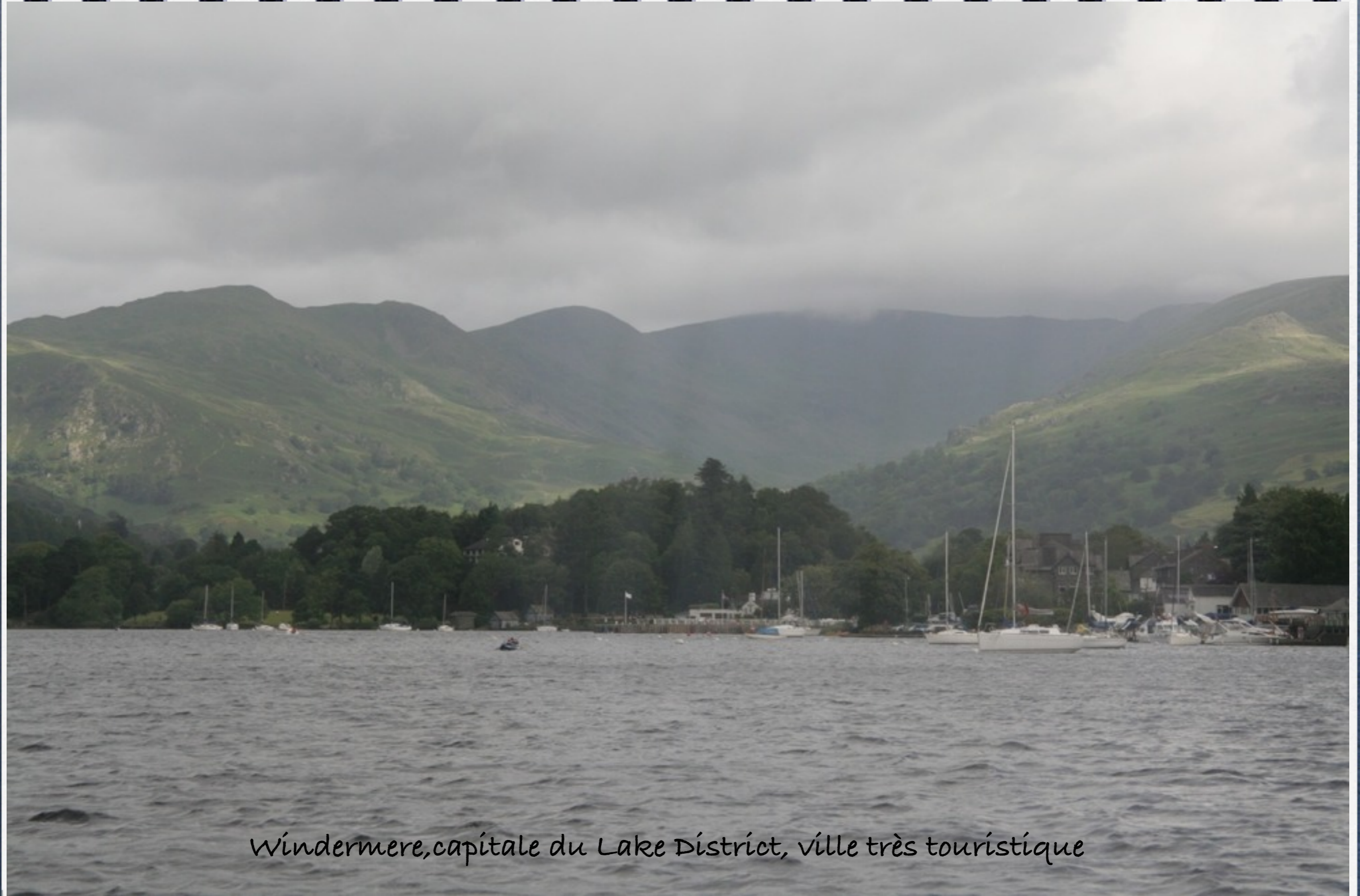
Windermere, capitale du Lake District, ville très touristique