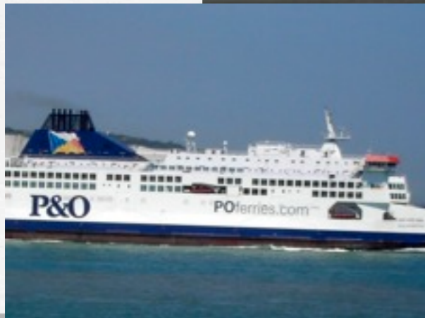
départ de Rotterdam avec PSO, direction Hull, en Grande-Bretagne