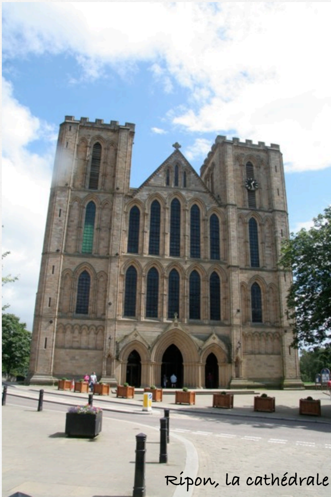
Ripon, la cathédrale