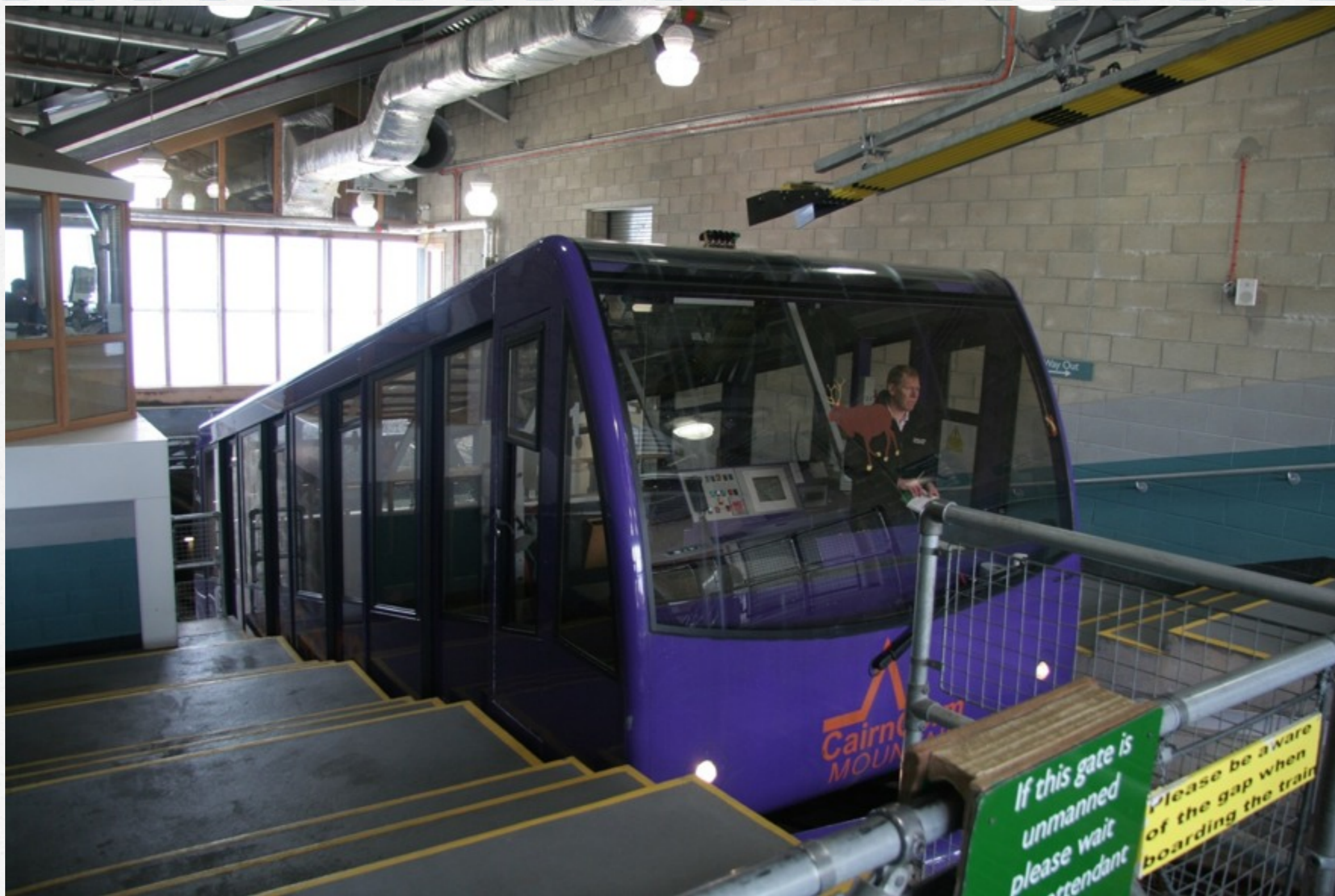
Cairngorm : le funiculaire nous monte à 1100m (L), le sommet est lui à 1295m