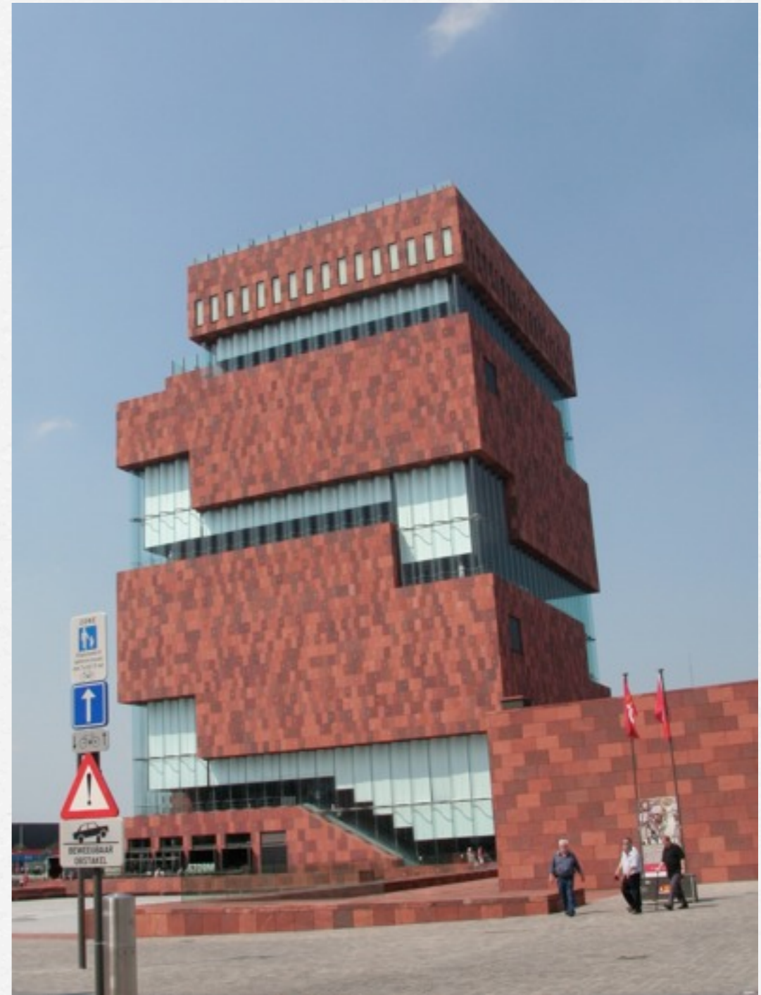
Le Mas, musée sur le fleuve