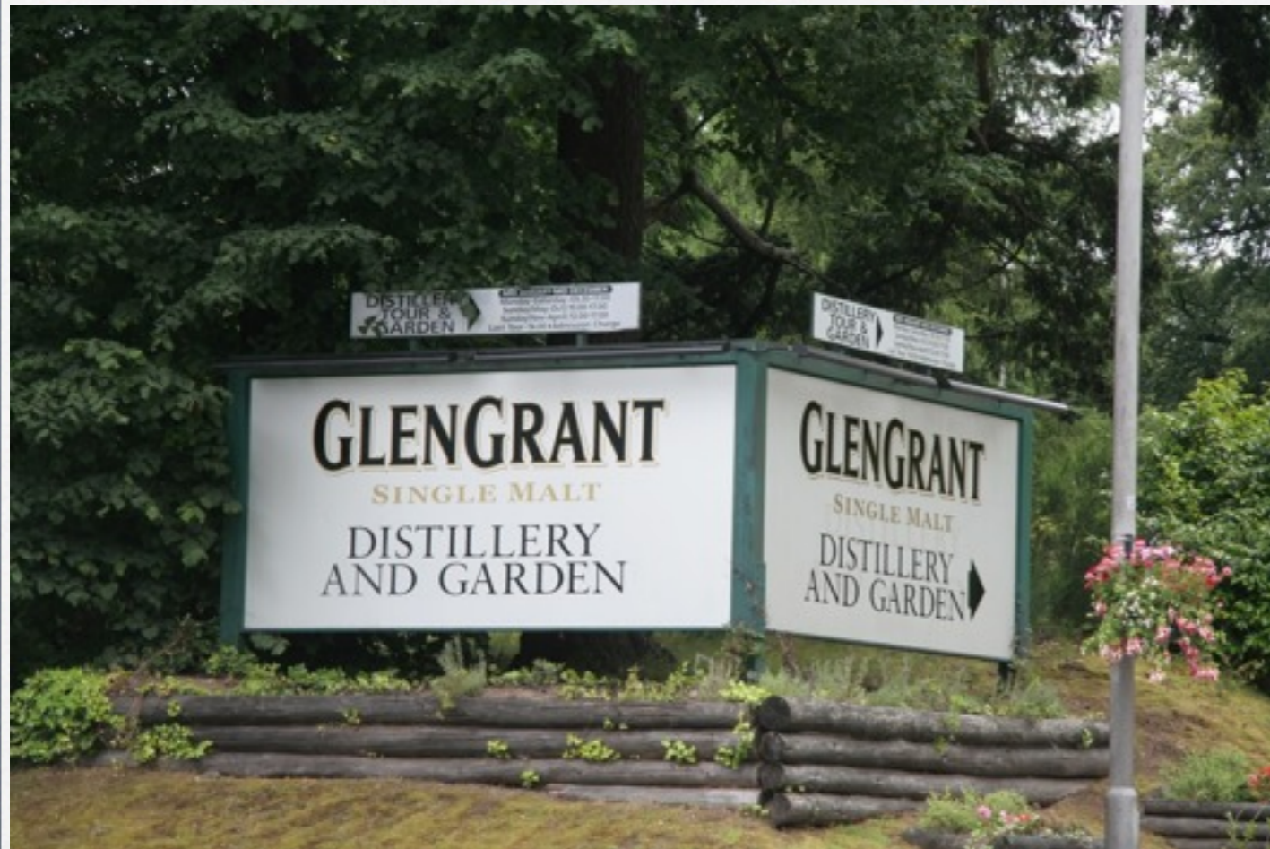
Glen Grant, à Rothes