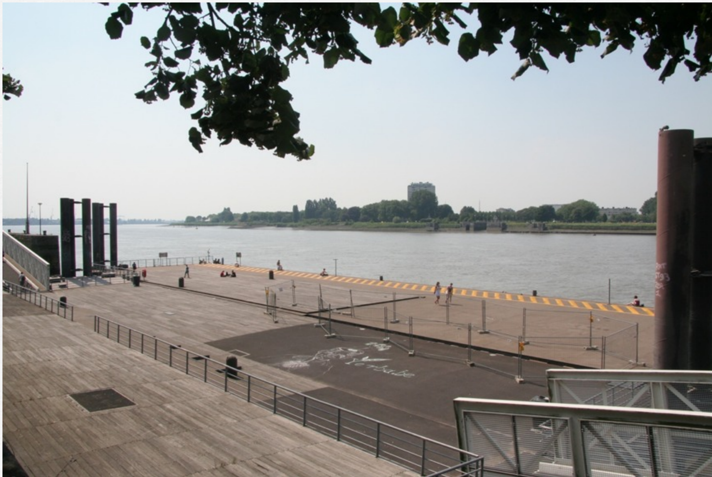
Antwerp, Les rives de l'Escaut