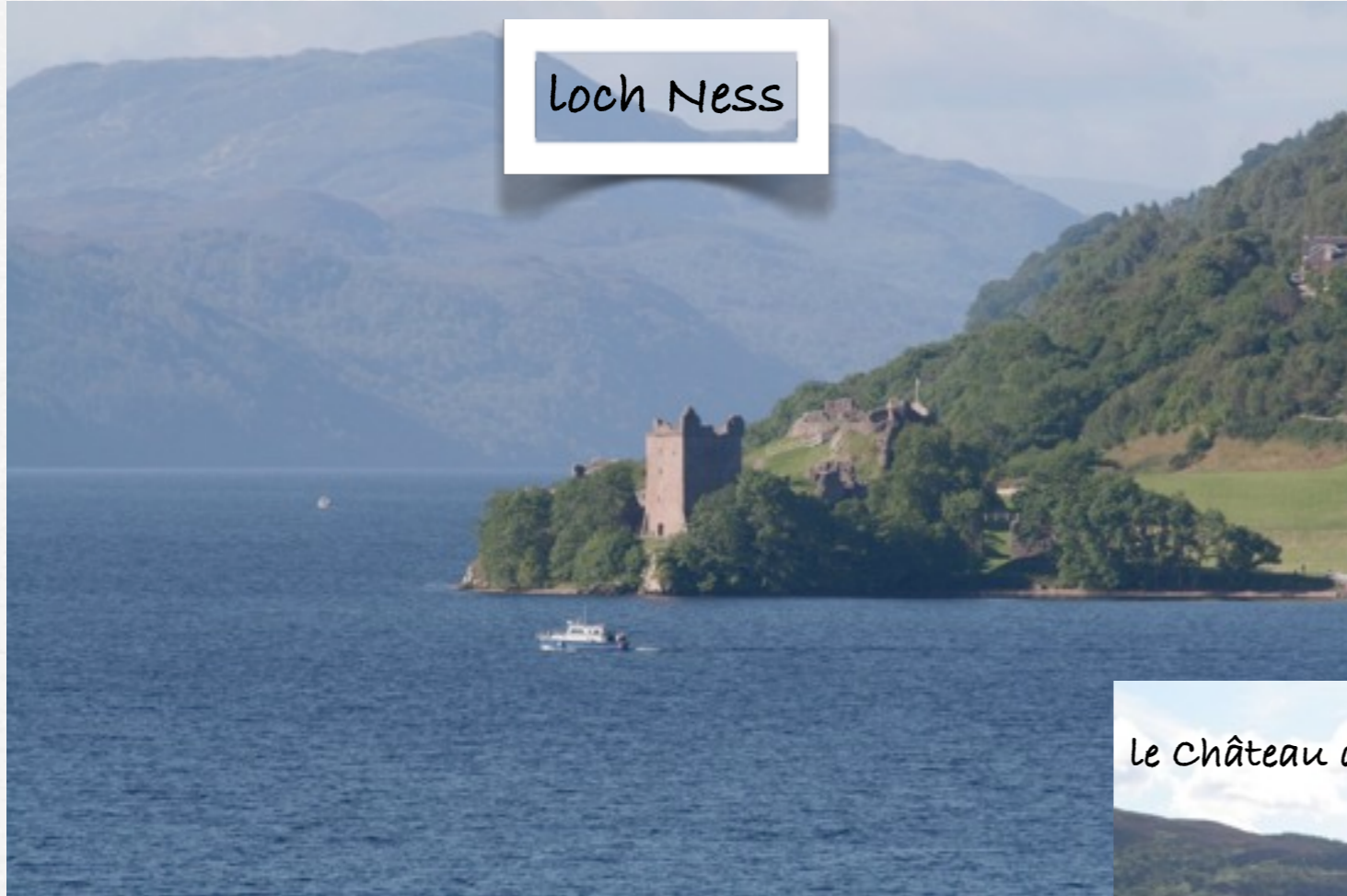
Le Château d'Urquart