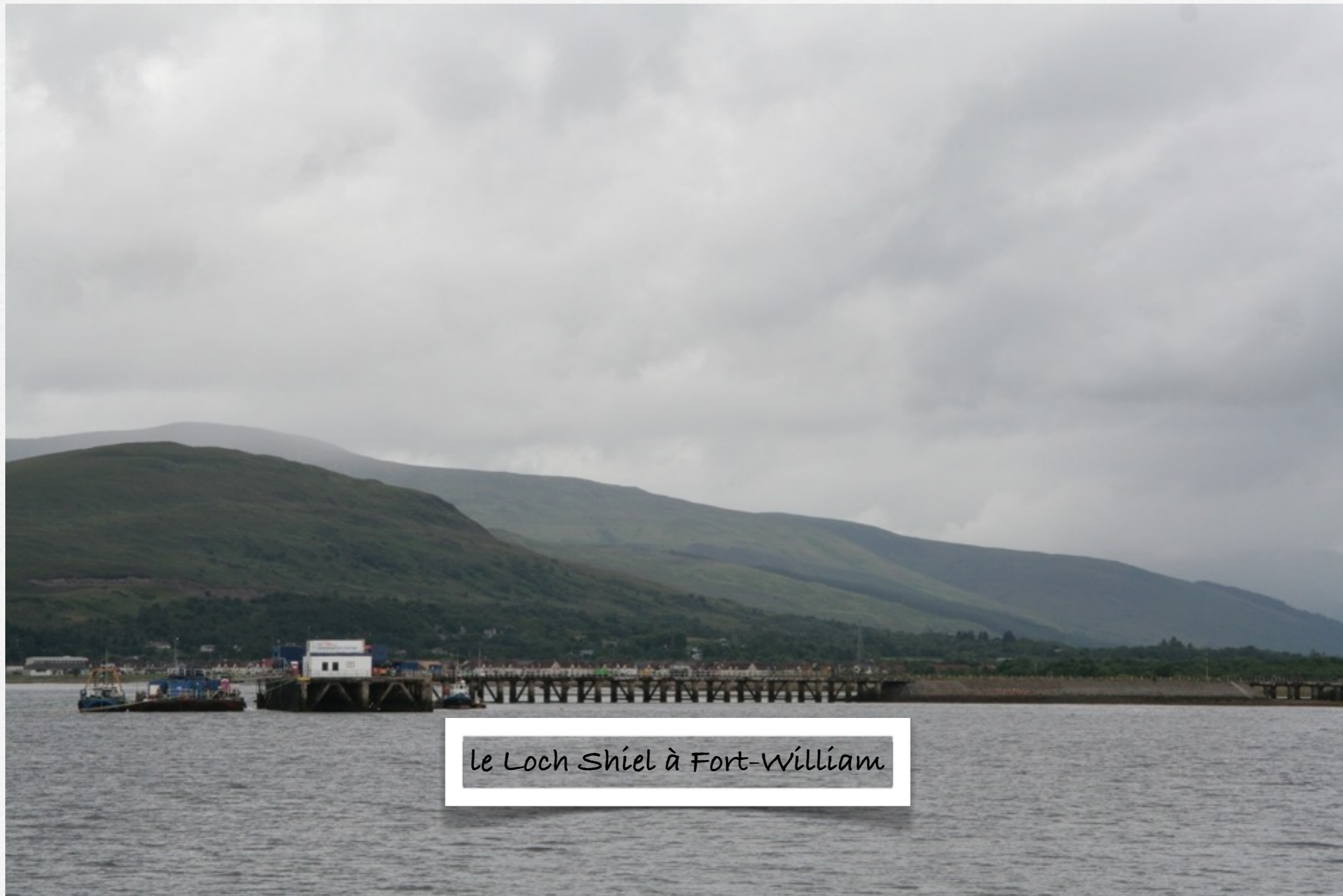
le Loch Shiel à Fort-William