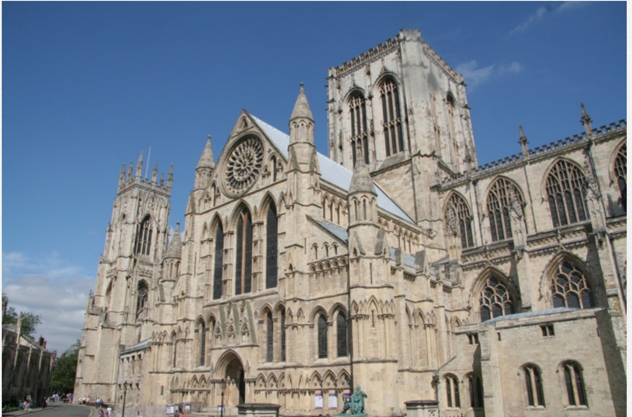
York, la cathédrale