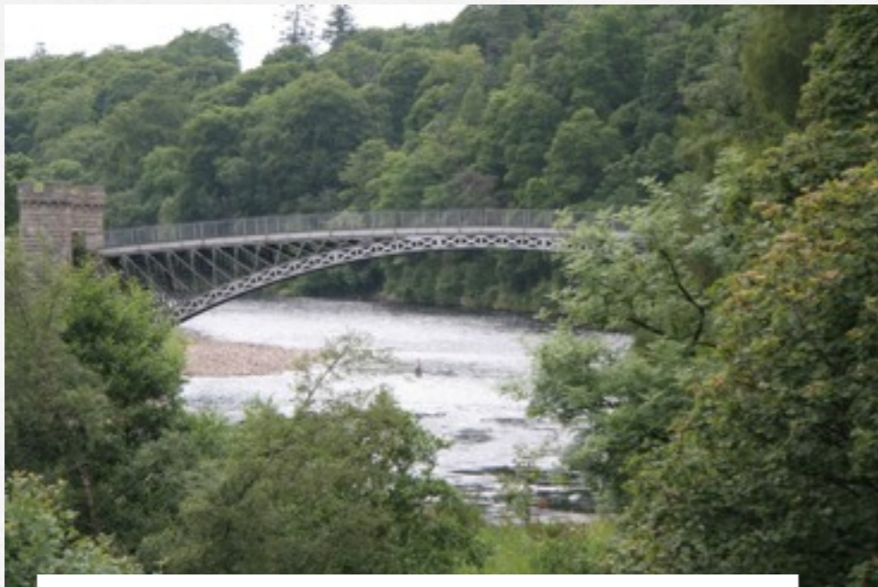
La Spey, à Craigglemachie